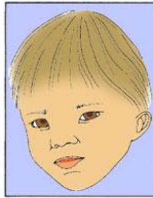
Дитина, уражена алкоголем